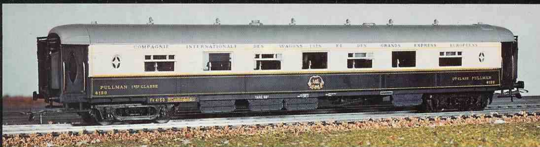
314 voiture salon « Pullmann »

Vous trouverez les descriptions, ainsi que les prix de nos modèles, dans la liste tarif jointe.