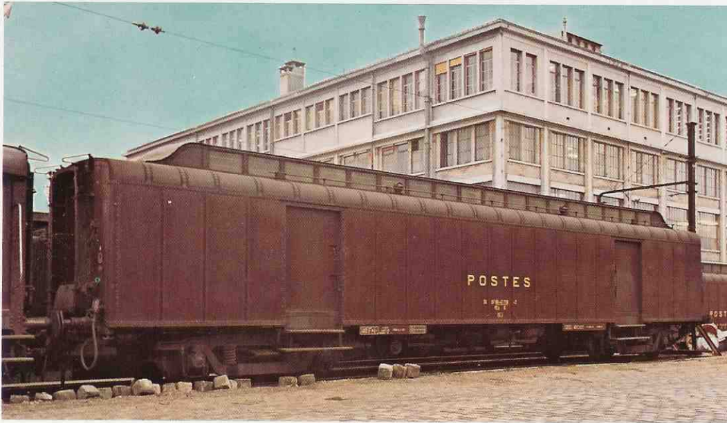
406 et 407 Allège Postale type SNCF et UIC

You will find the descriptions as well as the prices of our models in the price list attached.