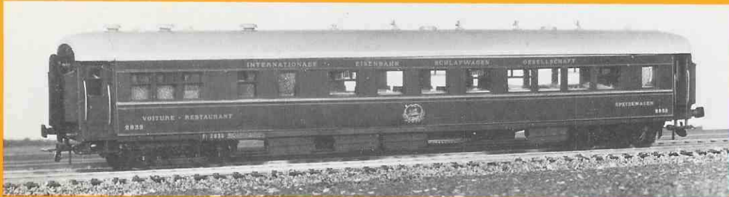
300 voiture restaurant type « Train Bleu » époque 1931 à 1939