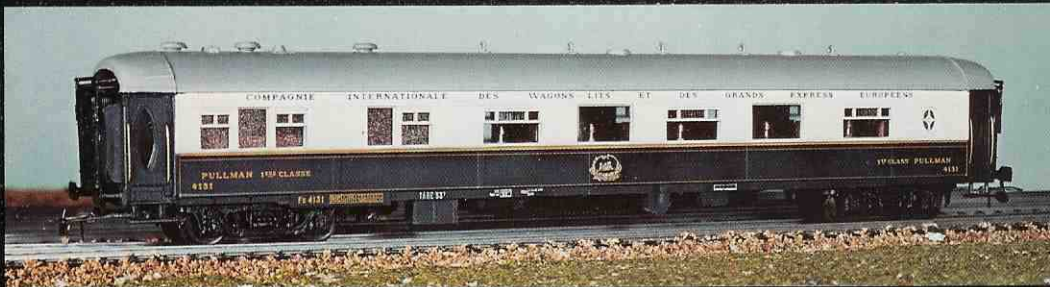
312 voiture salon « Pullmann » avec cuisine