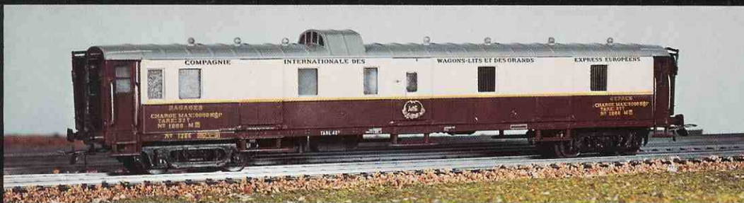
325 fourgon type « Flèche d'Or »