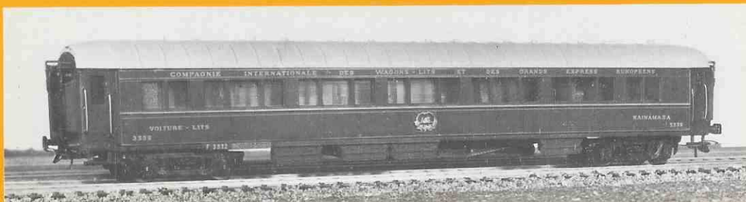
306 à 308 voiture lit type Z de la C.I.W.L.

Vous trouverez les descriptions, ainsi que les prix de nos modèles, dans la liste tarif jointe.