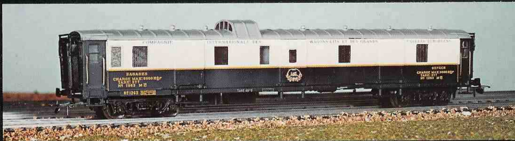
315 fourgon « Pullmann »

You will find the descriptions as well as the prices of our models in the price list attached.