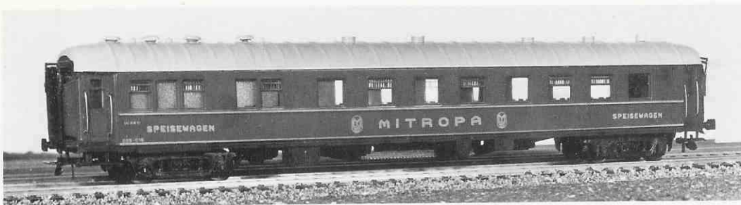
331 voiture restaurant rouge « Mitropa » (encore en service en RDA)