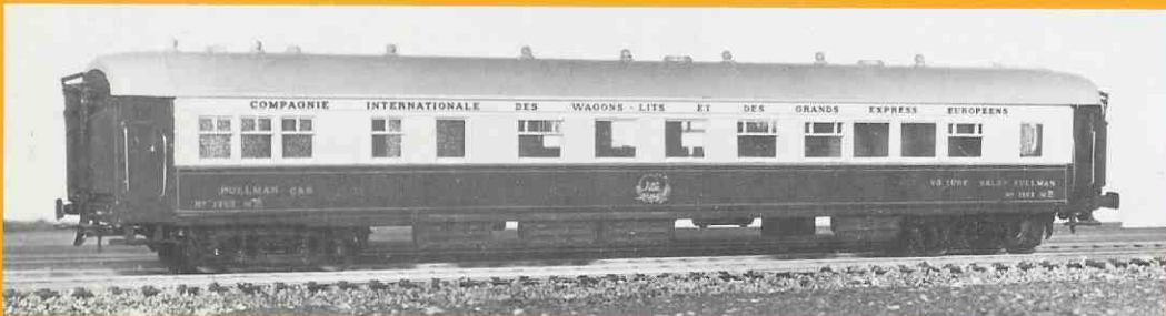
321 voiture restaurant type « Flèche d'Or » marron et crème

Eine Beschreibung sowie die Preise unserer Modelle finden Sie auf der beiliegenden Preisliste.