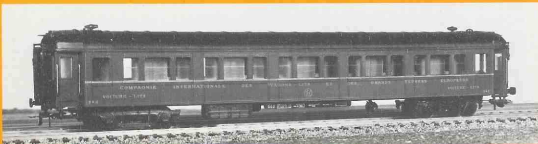
235 voiture couchette à rivets - bleue ex PLM