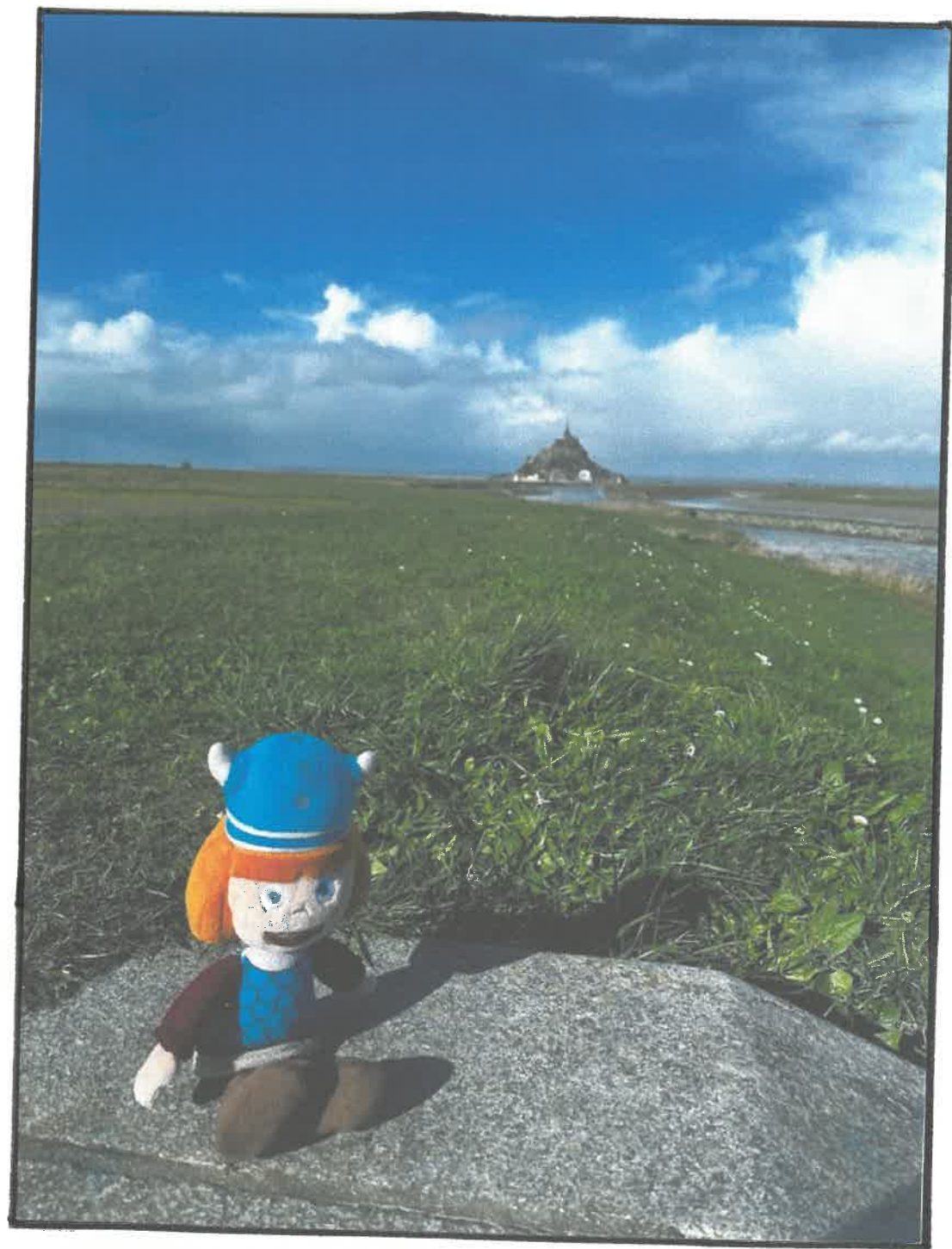
Vicki a profité des vacances pour aller visiter le Mont-Saint-Michel, c'est un monument magnifique !