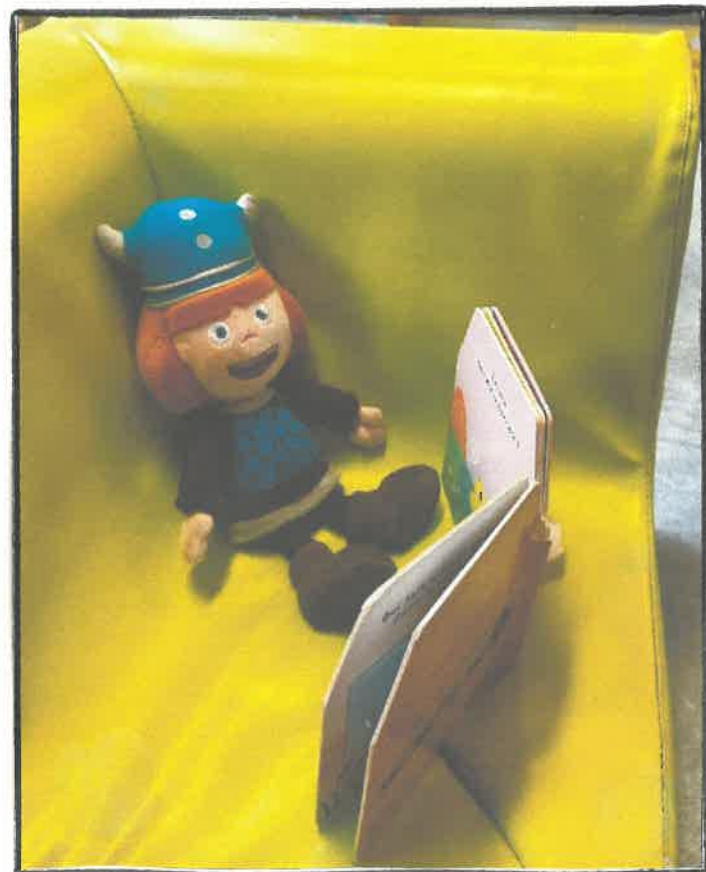
Vendredi 26 janvier, nous sommes allés à la médiathèque d'Avranches. Une bibliothécaire nous a lu des albums sur le thème des 4 saisons. Nous adorons les livres, et apparemment Vicki aussi !