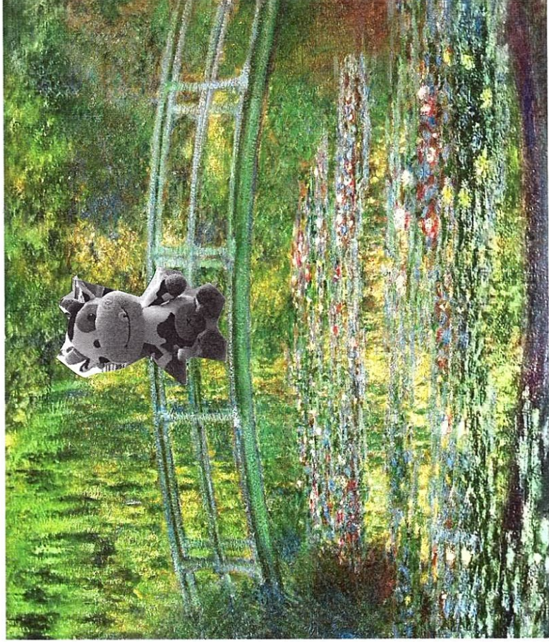
Le bassin aux nymphéas, Claude Monet

Nous travaillons sur l'impressionnisme et notamment sur les œuvres de Claude Monet.